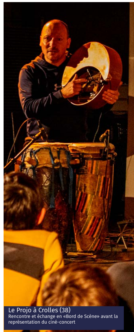
Le Projo à Crolles (38) Rencontre et échange en «Bord de Scène» avant la représentation du ciné-concert