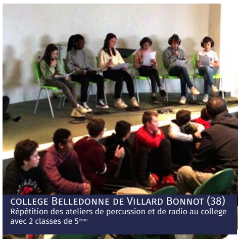
COLLEGE BELLEDONNE DE VILLARD BONNOT (38) Répétition des ateliers de percussion et de radio au college avec 2 classes de 5 ème