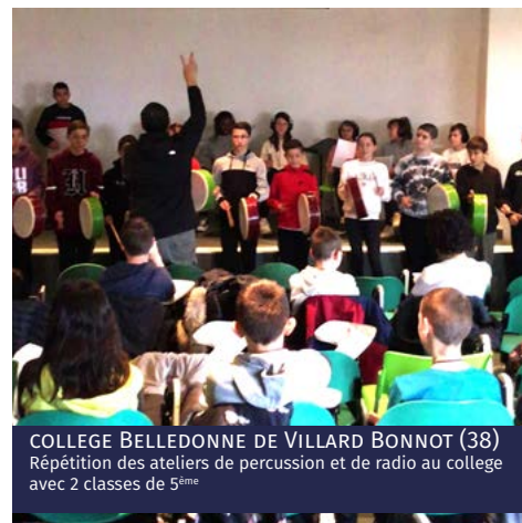
COLLEGE BELLEDONNE DE VILLARD BONNOT (38) Répétition des ateliers de percussion et de radio au college avec 2 classes de 5 ème