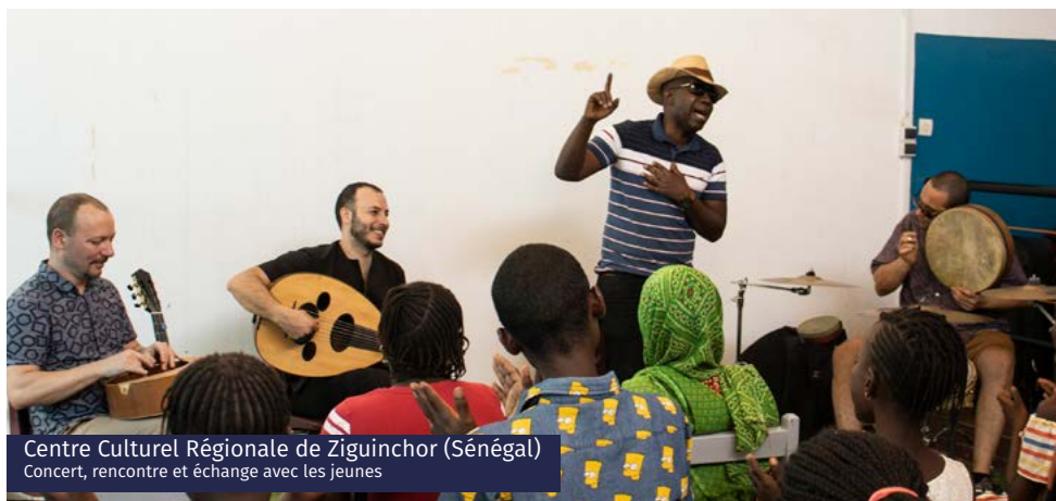
Centre Culturel Régionale de Ziguinchor (Sénégal) Concert, rencontre et échange avec les jeunes