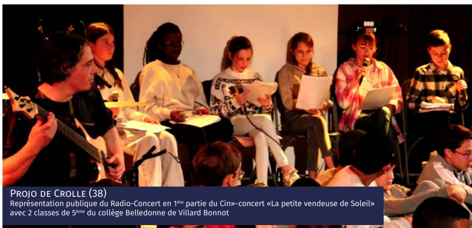
PROJO DE CROLLE (38) Représentation publique du Radio-Concert en 1 ère partie du Ciné-concert «La petite vendeuse de Soleil» avec 2 classes de 5 ème du collège Belledonne de Villard Bonnot