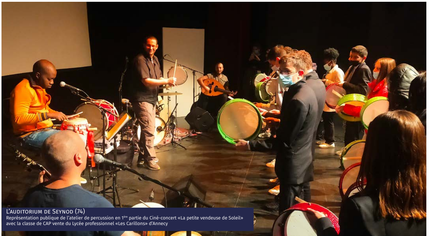
L'AUDITORIUM DE SEYNOD (74) Représentation publique de l'atelier de percussion en 1 ère partie du Ciné-concert «La petite vendeuse de Soleil» avec la classe de CAP vente du Lycée professionnel «Les Carillons» d'Anney