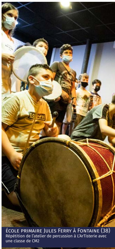
ÉCOLE PRIMAIRE JULES FERRY À FONTAINE (38) Répétition de l'atelier de percussion à L'ArTisterie avec une classe de CM2

Contenu pédagogique de l'atelier radio participative et plateau live : initiation aux techniques d'interviews, aux montage audio et aux logiciels son, développement d'un propos, rédaction d'une ligne éditoriale, interview de personnes extérieures (associations, professionnels, artistes ou autres, contactés au préalable par l'intervenant), expression orale, organisation d'un plateau radio live accompagné en musique . Les sujets « mis en son » par l'atelier radio peuvent être choisis par les participants ou proposés par les intervenants et/ou l'équipe enseignante.