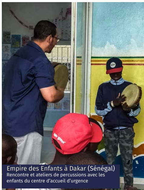
Empire des Enfants à Dakar (Sénégal) Rencontre et ateliers de percussions avec les enfants du centre d'accueil d'urgence