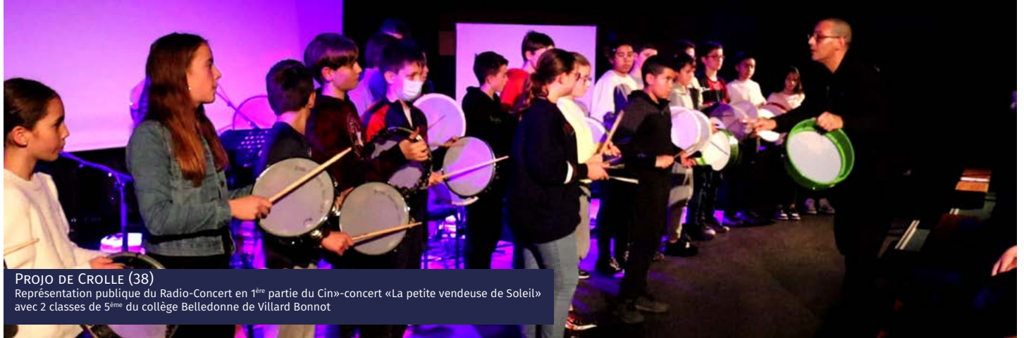
PROJO DE CROLLE (38)

Représentation publique du Radio-Concert en 1 ère partie du Cin-concert «La petite vendeuse de Soleil» avec 2 classes de 5 ème du collège Belledonne de Villard Bonnot