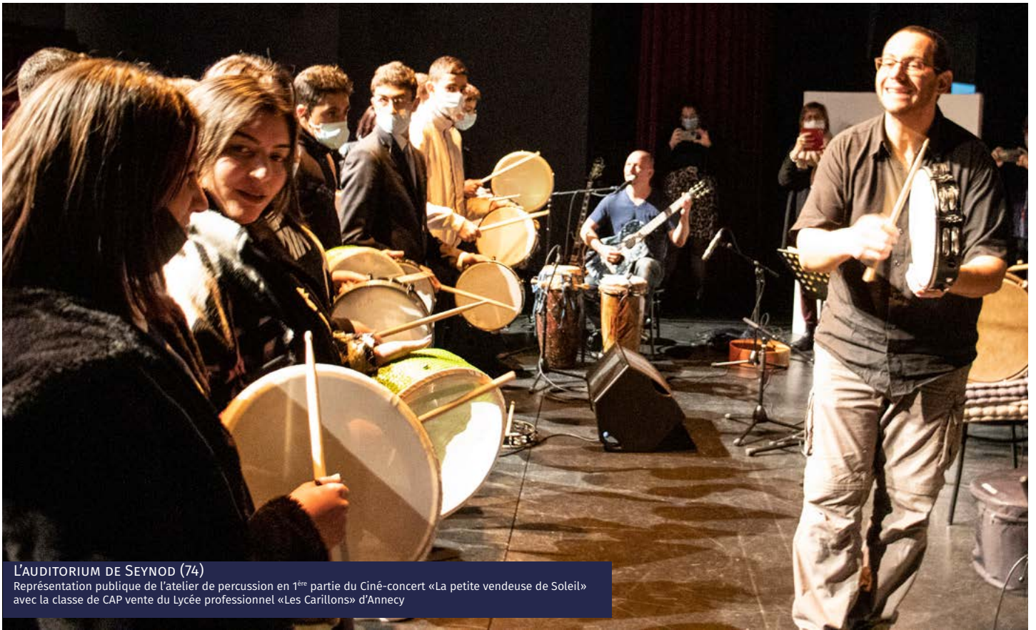
L'AUDITORIUM DE SEYNOD (74) Représentation publique de l'atelier de percussion en 1 ère partie du Ciné-concert «La petite vendeuse de Soleil» avec la classe de CAP vente du Lycée professionnel «Les Carillons» d'Annecy

Contenu pédagogique des ateliers «pratique collective des percussions» et «pratique vocale» : présentation des artistes, partage de « playlist » des participants pour une écoute en groupe des esthétiques musicales de chacun, discussion sur les apports de chaque style et l'inter-connexion entre les différentes musiques, présentation du ciné-concert (thèmes abordés par le film, travail de création sur une œuvre préexistante...), initiation aux notions qui permettent de structurer un discours musical (tempo, dynamique, métrique, structure mélodique...), travail sur les morceaux du répertoire, développement d'une polyrythmie, d'une polyphonie, d'appels musicaux pour les changements et fins de morceaux, répétition générale et restitution avec l'ensemble des artistes du spectacle sur la première partie de la séance scolaire en accompagnement du plateau radio.